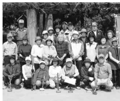
和やかに活発的な活動を

「名は体を表す」を地で行く二区連なごみ会。市内東部地区とは、いわゆる木下街道に沿う地域の鎌ヶ谷第二区連合自治会。そこに暮らす高齢者を対象に平成27年2月の発足。つまり、市老連下の最も若い老人クラブ。それ故に、何にでも、ど