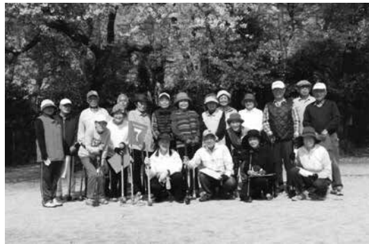
月4回のグラウンド・ゴルフ

唱練習も密にならないホールで続けています。会計事務などは、高齢者にとって負担になるので、対策を検討中です。