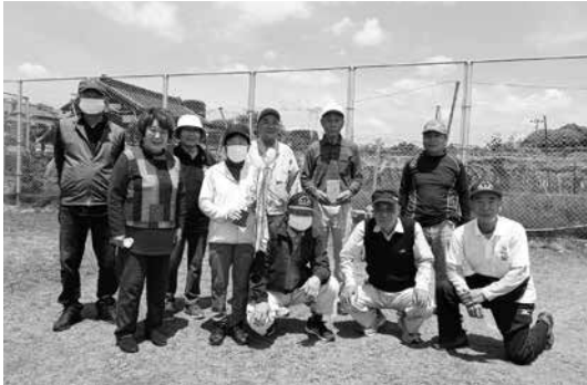
仲間とさまざまな活動

性26名、男性24名です。主な活動は、対面による通常の「定例会」「バス旅行」「暑気払い」「新年会」等ですが、この2年間はコロナ禍でほとんど自粛中です。ただ、人数制限を設け、保健師さんによる「健康増進教室」、防災・減災に関する「DVD視聴会」、物品配布(焼きそば、お弁当など)による見守り活動、会報の発行などを行なっています。 グループ活動は、ペタンク、踊り、脳トレ、ラジオ体操、公園の草取りなど活発に実施されています。それぞれのグループにはクラブからいろいろな支援をしています。