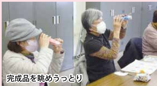
完成品を眺めうっとり

3月7日(月)総合福祉保健センターにて、鎌ヶ谷市手工芸連盟会長の小金力ヨ子先生を講師にお招きし手工芸教室が