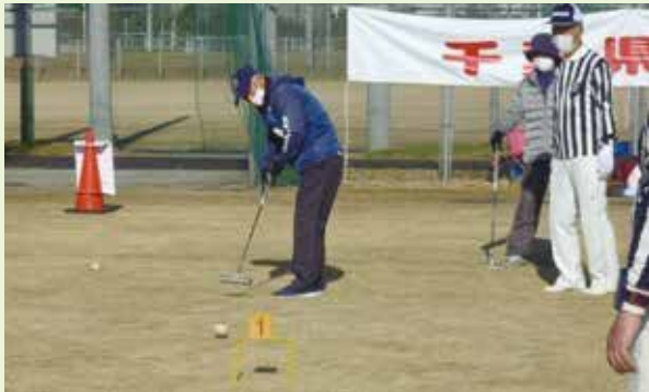
ゲート通過なるか