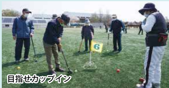
目指せカップイン

4月7日(木)桜が咲き誇る春の陽光の中、福太郎スタジアムにてグラウンドゴルフ大会が開催されました。会場には約100名が集まり、温かい日差しの下で熱戦が繰り広げられました。大会の結果は表のとおりです。