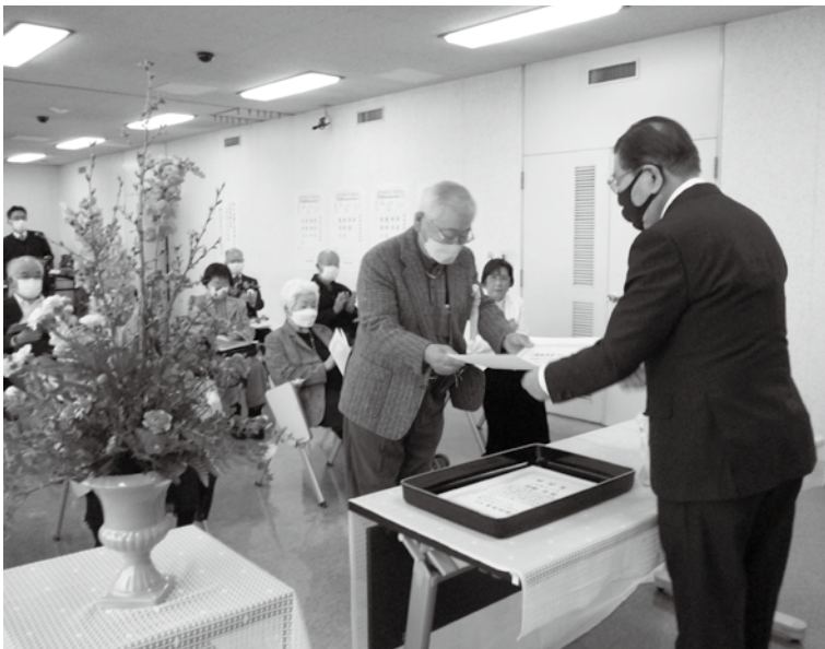
受賞おめでとうございます